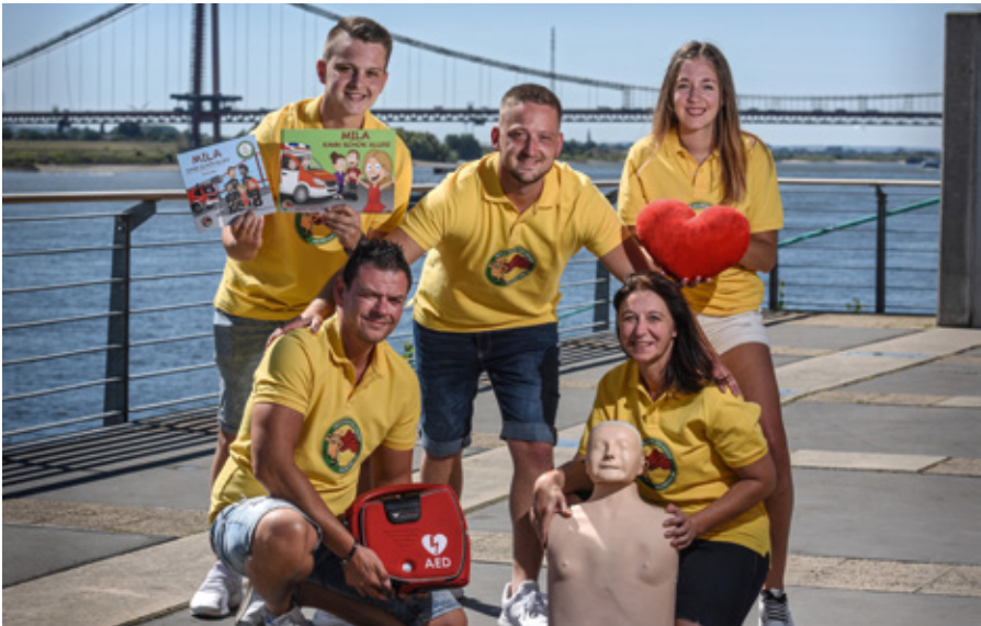
Das Team der Rennecke-Medic

Anmeldung für alle Kurse online auf unserer Webseite.