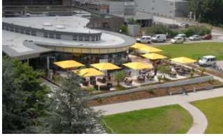
Betriebsteil 1: Evangelisches Krankenhaus Duisburg-Nord