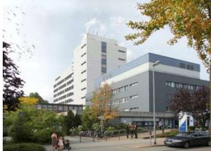
Betriebsteil 4: Evangelisches Krankenhaus Dinslaken