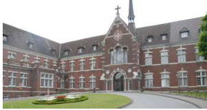
Betriebsteil 2: Johanniter Krankenhaus Oberhausen-Sterkrade