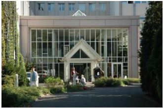
Betriebsteil 3: Herzzentrum Duisburg Duisburg-Meiderich